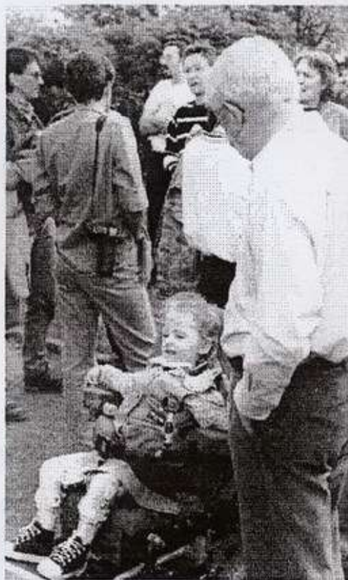
Quand deux mascottes se rencontrent

Pendant cette rencontre, tout ce qu'on a pu recevoir d'eux, c'était formidable.