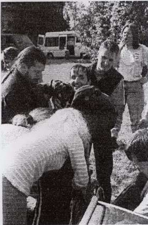
Deuxième étape : serrer les fesses

Les motards étaient super sympas. On a eu des échanges dingues, des moments chauds comme on peut avoir avec des motards. On était fier. On a vu que la vie au ras du bitume c'est formidable. On roulait assez vite quand même. On était pas à fond, mais c'était assez rapide pour nous. Le fait d'avoir le visage à l'air, sans casque, on se sent en partie libre. Qu'est-c'qu'on se sent bien quand on est libre, on peut faire c'qu'on veut, c'est chouette. J'me souviens quand j'étais même, mes parents