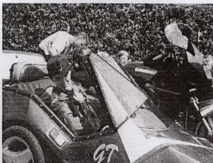
Troisième étape : prendre place et se rassurer.

m'avaient acheté une "Flandria" orange vif, une 49,9cc. Elle était chouette. On lime un peu les culbutos et échappement libre, ça fait du bruit, c'est tout. Mais ça suffisait pour se casser la gueule. J'me suis ramassé plusieurs fois, sans casque. J'me suis mangé une voiture, boulevard de l'Hôpital à Paris, sur les pavés, ça ne pardonne pas. La fourche pliée en quatre. J'me suis relevé et puis le lendemain on remet ça.