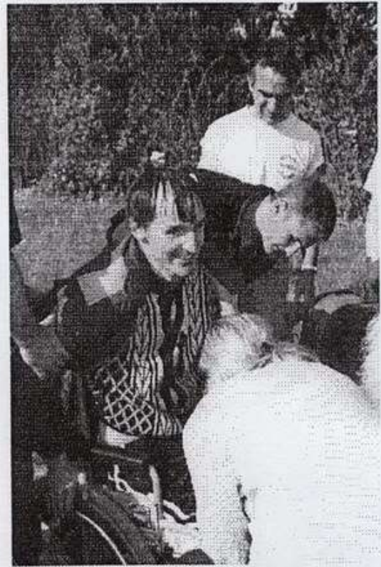
Première étape : sortir du fauteuil.

L a première chose que m'a demandé le pilote : ça va, t'as pas peur, t'as confiance ? Et oui, mon chauffeur était lui aussi handicapé, se déplaçant en fauteuil après avoir subi un accident de la route. Moi confiant, je n'ai eu aucune hésitation. Sa moto est aménagée avec les commandes au guidon, puisque les jambes ne peuvent plus commander.